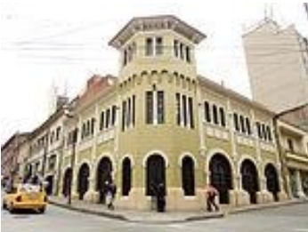
Edificio Sede Confamiliares