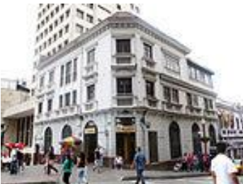
Edificio Alejandro Gutiérrez