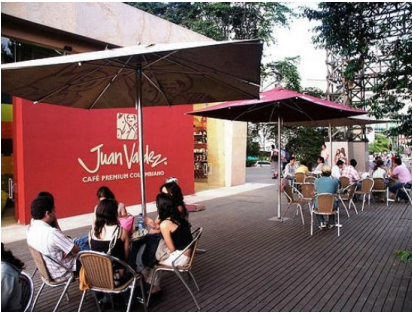
Juan Valdez Café