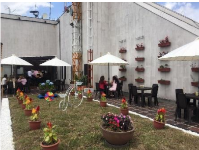
Café Torre Atlas