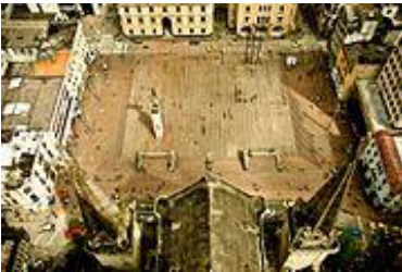
Plaza de Bolívar