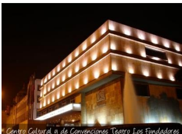
Teatro Los Fundadores

Nuestro recorrido esta vez inicia en el Estadio Palogrande sede del campeón de Copa Libertadores de América 2004 Once Caldas; Continuamos por la Ciudadela Universitaria hasta el Sector del Cable, con una parada en Juan Valdez; continuamos por la Avenida Santander hasta llegar al Teatro Fundadores, con visita al Cable Aéreo; Continuamos hacia el Templo de la Inmaculada, Catedral Basílica, y Plaza de Bolívar; Una parada para un café en la Torre Atlas, antes de bajar a la Plaza de Mercado; Como se acerca la tarde, debemos llegar hasta la Plaza de Toros, para luego subir al Monumento a los Colonizadores en Chipre y a la Torre de Chipre, y finalizar con la evidencia del porque Pablo Neruda llamó a la ciudad “Fábrica de Atardeceres”.