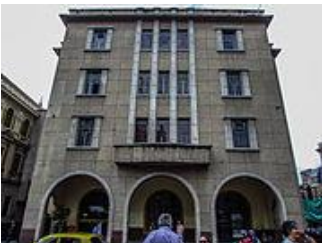
Edificio de la Licorera