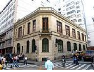
Edificio Banco Popular